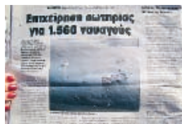
Olyckan har fått mycket stort utrymme i grekisk media. De oklara omständigheterna har även fått i gång vilda spekulationer.

” Jag vill också veta vad i hela fridens namn som hände. Men det har varit förvånansvärt tyst om det här.