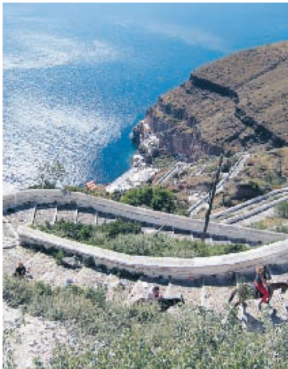
De evakuerade passagerarna fick ta sig upp från hamnen till fots, med åsna eller i en liten kabinbana. Längst nere i hamnen syns de livbåtar som användes.